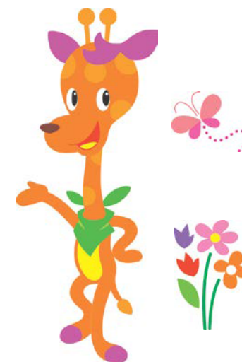
マスコットキャラクター モリリン