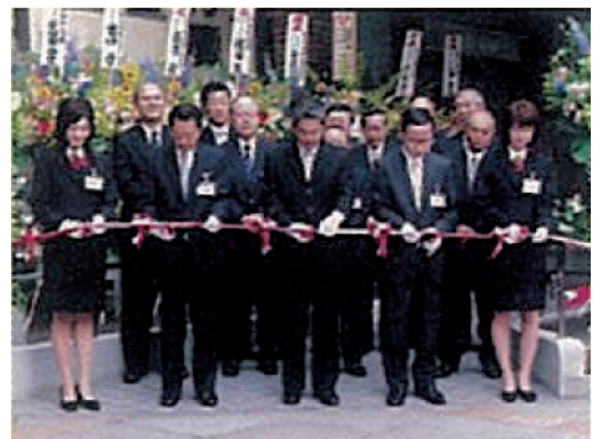
「杜の都信用金庫」スタート