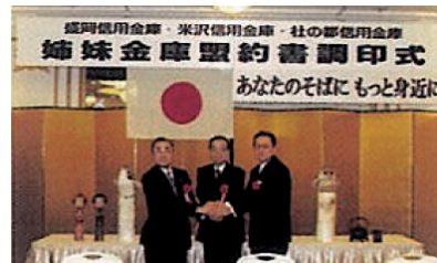
姉妹金庫盟約締結