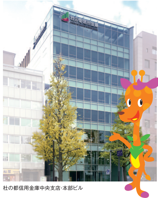
杜の都信用金庫中央支店・本部ビル