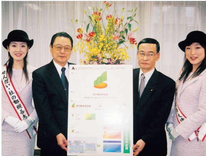
新信用金庫名称「杜の都信用金庫」決定

7月23日、仙台信用金庫と塩竈信用金庫の「合併基本協定書」に調印 12月7日、仙台信用金庫と塩竈信用金庫の「合併契約書」締結 新信用金庫名称「杜の都信用金庫」決定