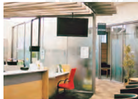
やすらぎプラザ(泉中央支店内)

やすらぎプラザ ■平日/9:00~17:00 ■土・日・祝/ 4月~11月 9:00~16:00 12月~3月 10:00~15:00 ☎ 0120-756-870