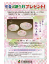
年金を当金庫でお受け取りのお客さまへ素敵な誕生日プレゼントを差し上げております。