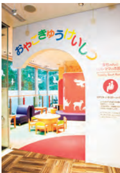
中央支店・本部ビル2階に、小さなお子さまとゆっくり休憩いただけるスペース「赤ちゃんとお母さんのお部屋」を設置しております。

当金庫では、接客サービス向上を目指す職員のロールモデルとして、各店にCSリーダーを配置し、「笑顔で 元気に 前向きに!」を合言葉にお客さまへの気配りと対応マナーの向上に取り組んでおります。また、ご来店されたお客さまの利便性向上に向け、店舗設備の充実に取り組んでおります。