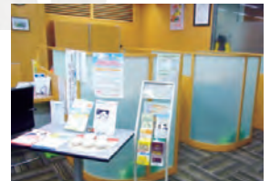
ファイナンスセンター(中央支店内)

ファイナンスセンター ■平日/9:00~17:00 ■土曜日/ 4月~11月 9:00~16:00 12月~3月 10:00~15:00 ☎ 0120-116-401