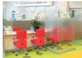
ふれあいプラザ(北仙台支店内)

ふれあいプラザ ■平日/9:00~17:00 ■土曜日/ 4月~11月 9:00~16:00 12月~3月 10:00~15:00 ☎ 0120-201-823