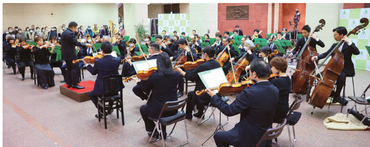
県民ロビーコンサート ■開催日時:毎月第4水曜日の午後0時15分~0時45分(30分間) ■開催場所:宮城県庁行政舎1階ロビー ※そのほか、スペシャルコンサートも予定されております。

2022年度は、年間12回の定例コンサートと年2回(夏・秋)のスペシャルコンサートが開催されました。ネーミングライツ取得14年目となる2023年度も引き続き宮城県と契約更新を行い、4月の「仙台フィルハーモニー管弦楽団」による演奏を皮切りに、今後も毎月開催される予定です。