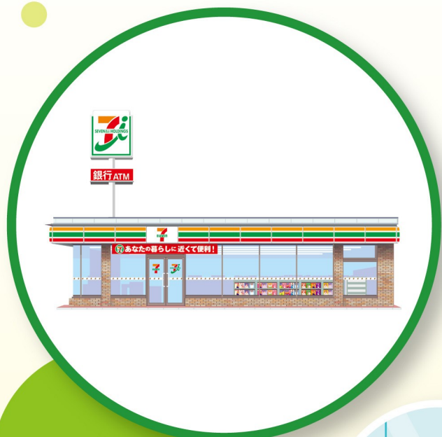
セブン-イレブンで

セブン-イレブンをはじめ、駅、商業施設、空港など 全国に25,000台以上あって、とっても便利!